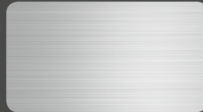
naturAL LINE | 401