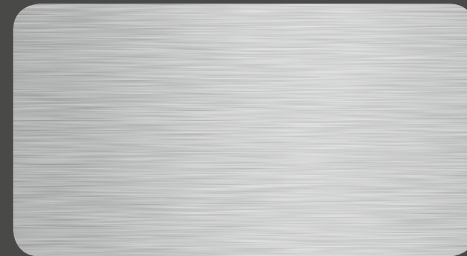
naturAL BRUSHED | 400