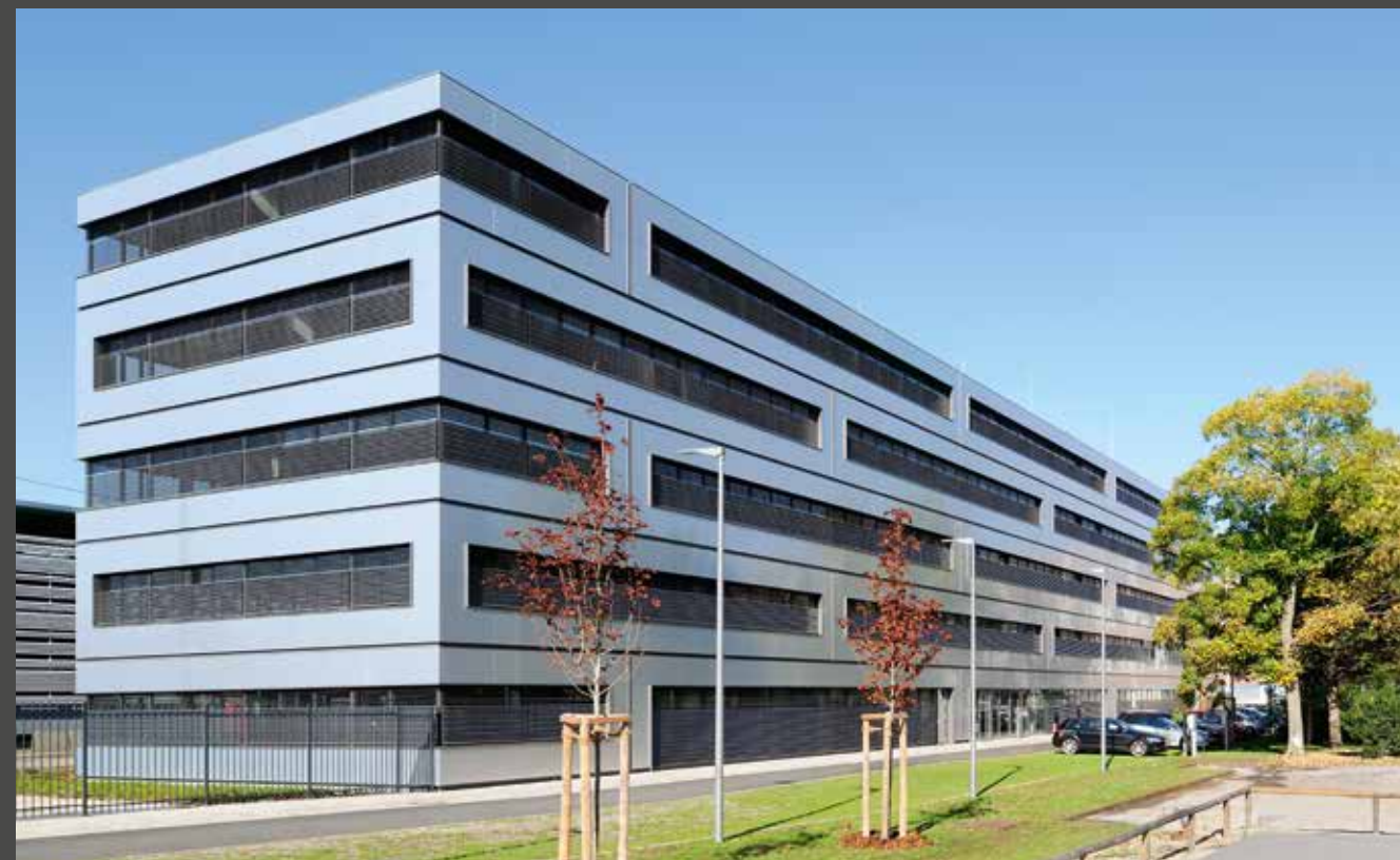
Technopark Siemens AG, Nuremberg, Germany | Architect: Brückner & Brückner Architekten | Material: naturAL BRUSHED