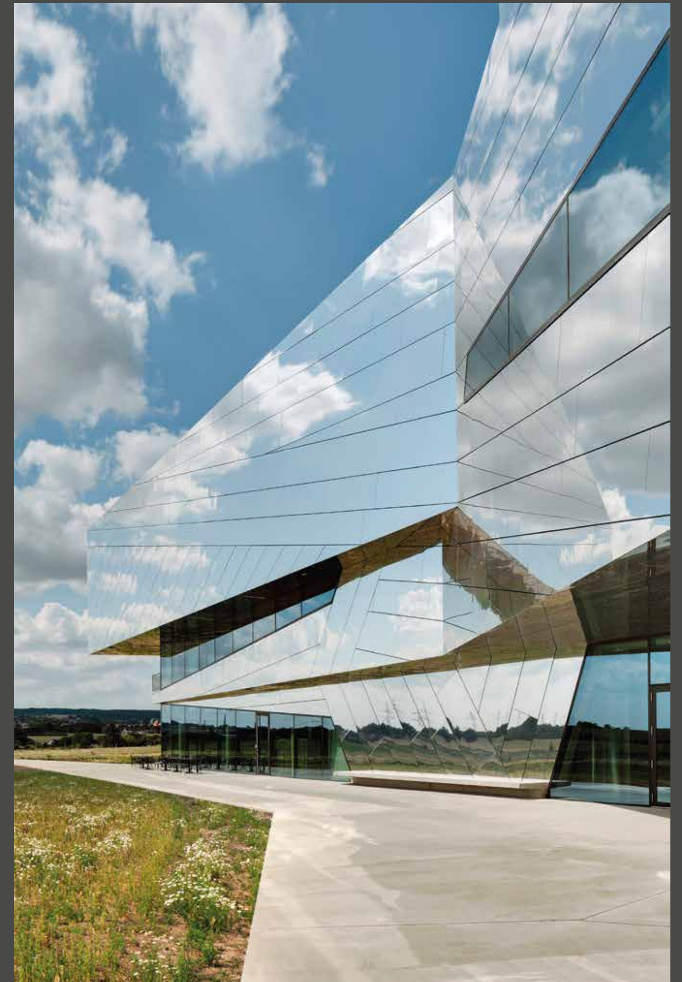
Paläon, Schöningen, Germany | Architects: Holzer Kobler Architekturen Zürich, PBR Magdeburg | Material: naturAL REFLECT | © Jan Bitter