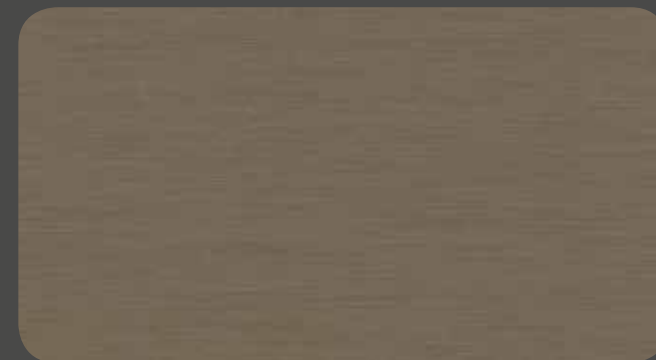
naturAL HAVANNA MG | 432