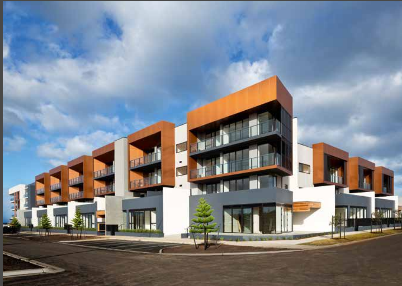
Wyndham Harbour, Australia | Architect: Fender Katsalidis | Material: naturAL COPPER | © Angus Martin